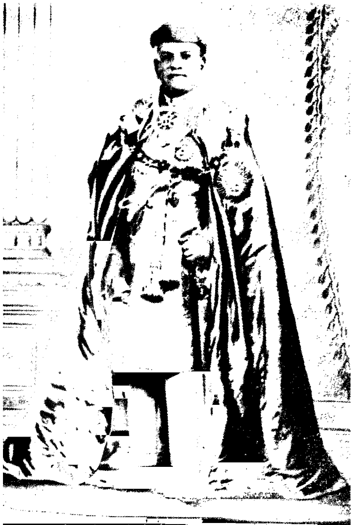
श्रीमान् महाराजा सर सदाजीराव गावकवाड, वडोदा-नरेश